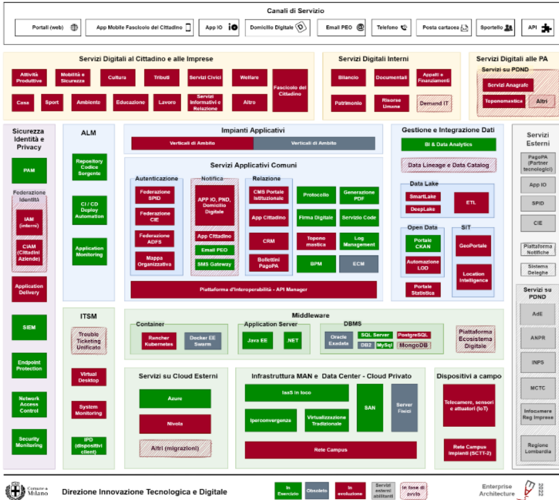
Figura 2 - Architettura di Transizione