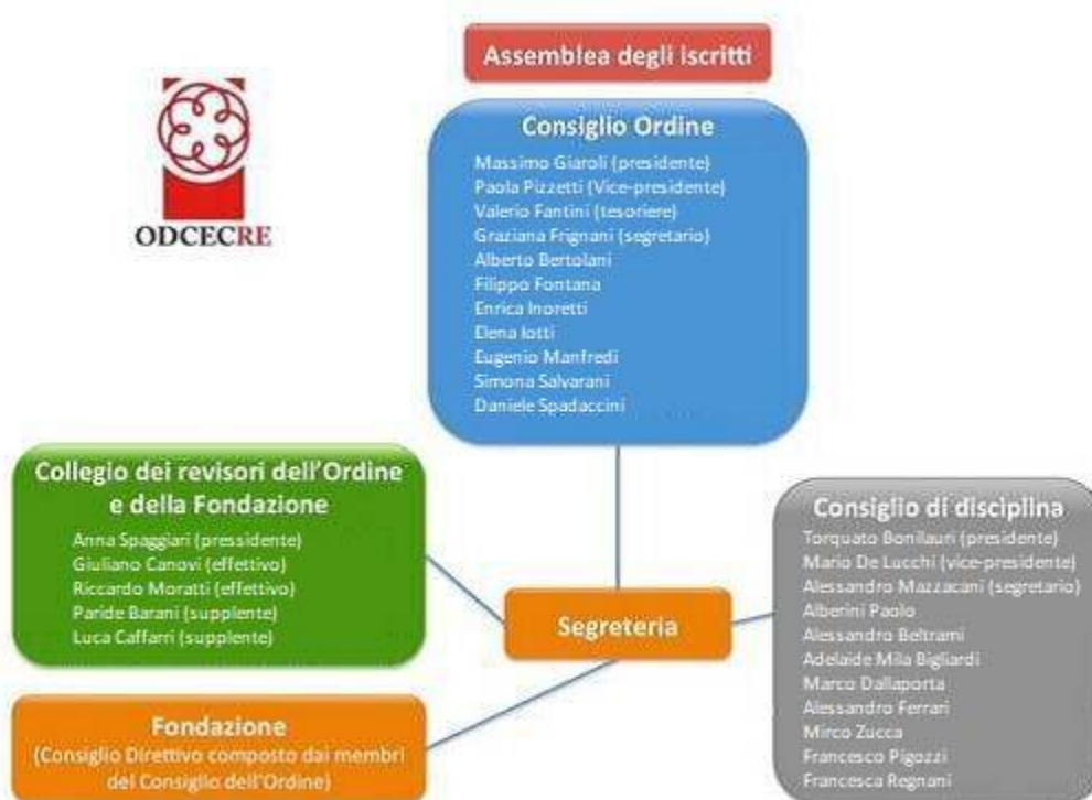
Figura 1 - Organigramma dell'Ordine dei Dottori Commercialisti e degli Esperti Contabili di Reggio Emilia