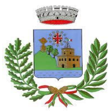
Comune di Villanova Monteleone