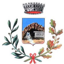
Comune di Romana