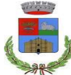
Comune di Mara