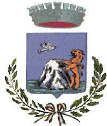
Comune di Monteleone Rocca Doria