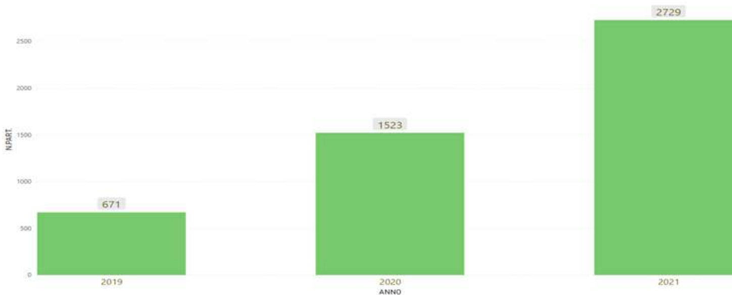
N.PART. per ANNO