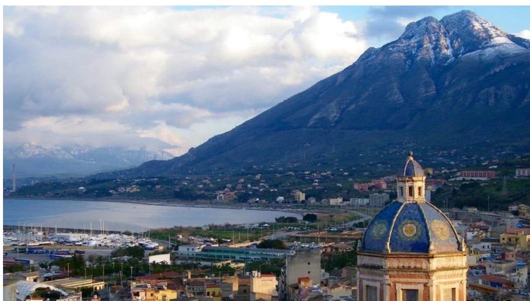
Termini Imerese: veduta della Città, con in primo piano la cupola della chiesa Maria SS. Annunziata