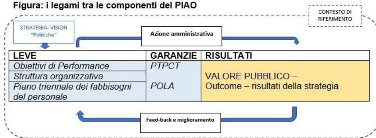
Figura: i legami tra le componenti del PIAO