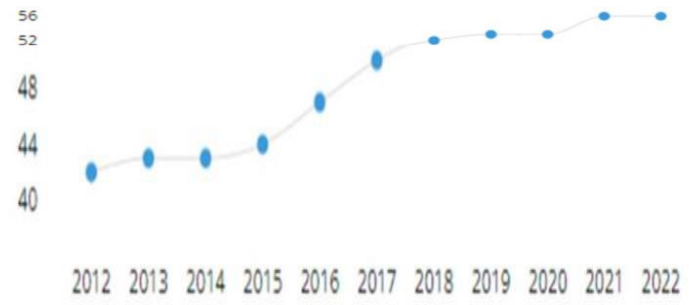
Score changes 2012 - 2022