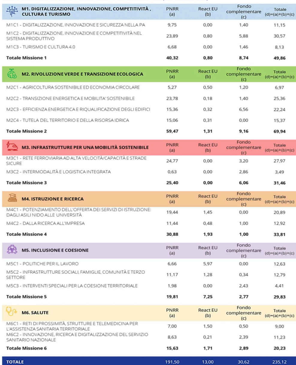
TAVOLA 1.1: COMPOSIZIONE DEL PNRR PER MISSIONI E COMPONENTI (MILIARDI DI EURO)

Le Componenti sono aree di intervento che affrontano sfide specifiche, composte a loro volta da Investimenti e Riforme.