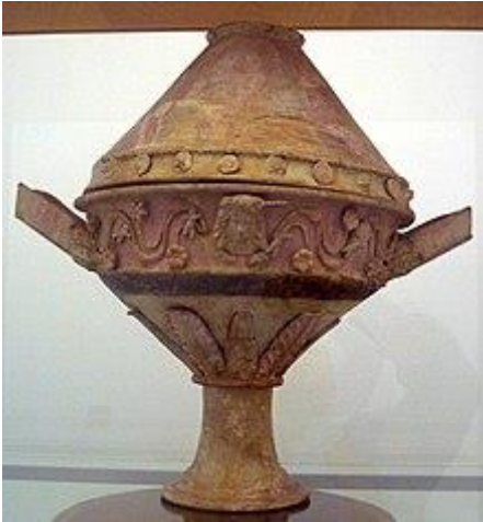
Museo di Palermo, vaso centuripino (epoca 280÷220 a.C.)Lekanis

Nel 368 prese il potere Nicodemo e governò fino al 339 a.C. , anno in cui Timoleonte lo costrinse a fuggire e deportò gli abitanti a Siracusa ripopolando la città con nuovi coloni. Ventisette anni dopo la città cadde sotto il brutale controllo del tiranno siracusano Agatocle . Diodoro afferma che a Centuripe, intorno al 312, era presente una guarnigione militare siracusana: