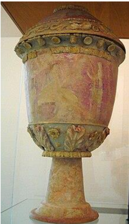
Vaso centuripino al museo archeologico di Palermo (280÷220 a.C.)

Notevoli sono le emissioni monetali di età romana repubblicana.