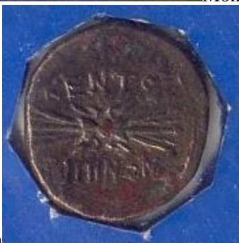
città Moneta di bronzo del 240 a.C. con i fulmini di Giove e la scritta (rovescio)