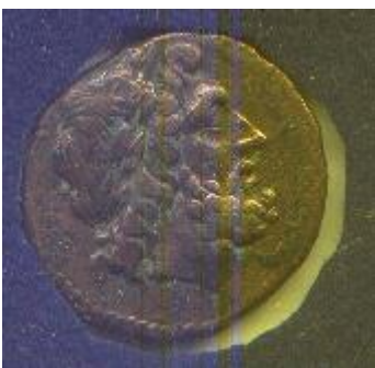
Moneta di bronzo del 240 a.C. con testa di Giove protettore della

Verso il 404 a.C. Centuripe cadde sotto la tirannia di Damone alleato di Dionisio I di Siracusa .