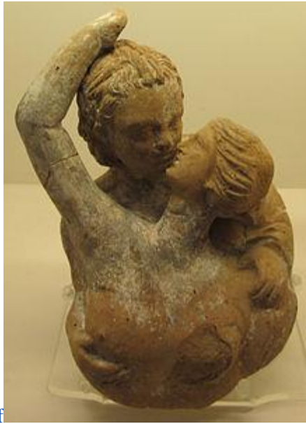
centuripino al museo di Düsseldorf (epoca 200÷100 a.C.)