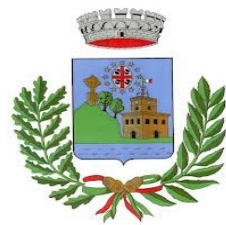
Comune di Villanova Monteleone