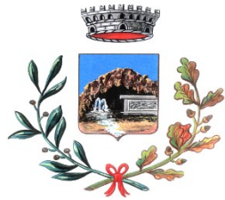
Comune di Romana