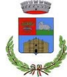
Comune di Mara