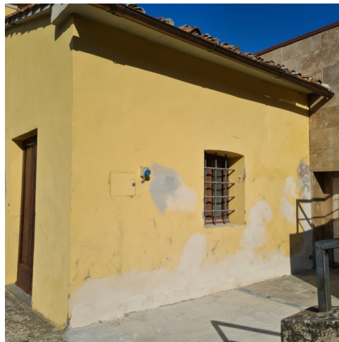
Cimitero di Forcoli