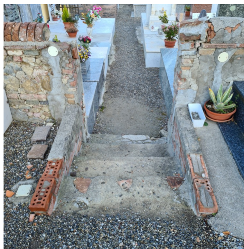
Cimitero di Alica