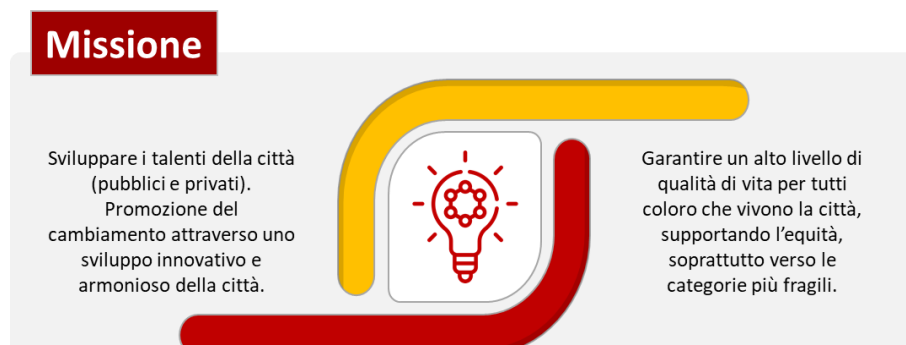
Figura I.II: La Missione

Coerentemente, si declina anche la missione dell'Amministrazione caratterizzata da una duplice natura: da un lato garantire il continuo miglioramento dei servizi in un'ottica di inclusione dei