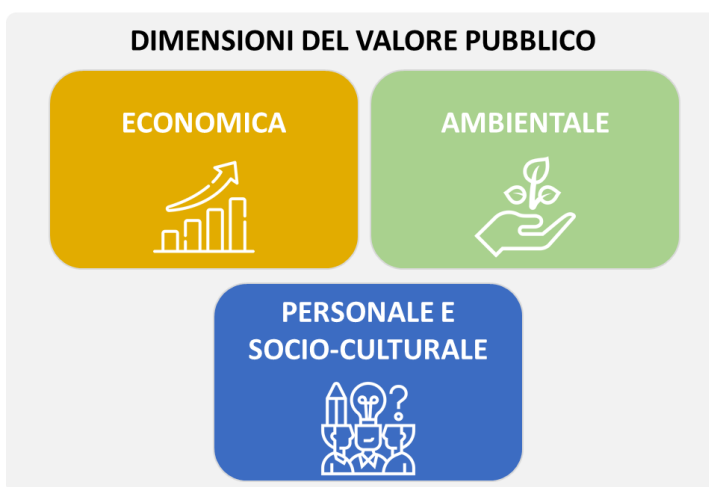
Figura II.II: Le dimensioni del Valore Pubblico