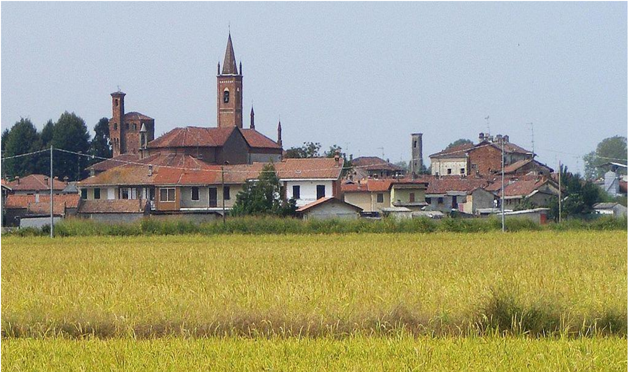
Veduta di Casanova Elvo (VC)

Allegato "A" alla deliberazione della Giunta comunale n. 28 del 26/05/2023