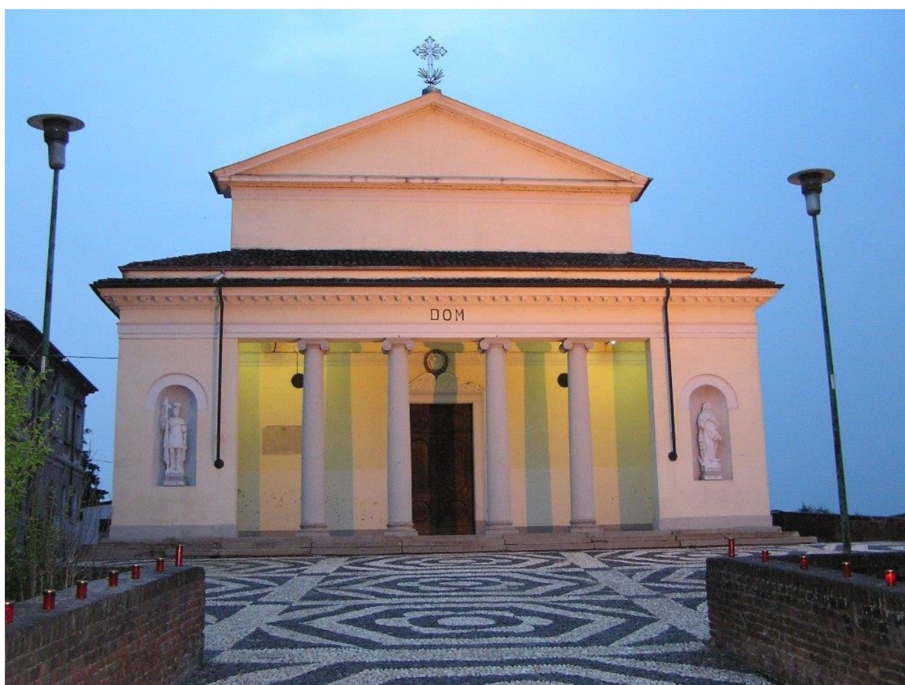
Parrocchia della Beata Vergine Assunta ad Asigliano Vercellese (VC)

ex art 6 del D.L. 9 giugno 2021, n. 80, convertito con modifiche dalla Legge 6 agosto 2021, n. 113