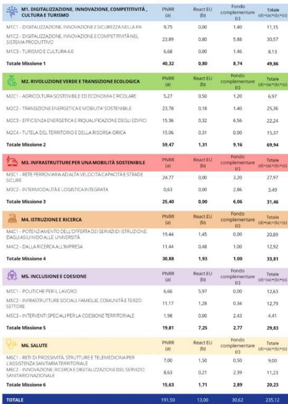
TAVOLA 1.1: COMPOSIZIONE DEL PNRR PER MISSIONI E COMPONENTI (MILIARDI DI EURO)

Un ulteriore riferimento per gli indirizzi e obiettivi strategici è rappresentato dal Piano nazionale di Ripresa e resilienza che orienta l'azione dell'amministrazione sempre in un'ottica di valore pubblico, il PNRR si sviluppa intorno a tre assi strategici condivisi a livello europeo, ovvero digitalizzazione, transizione ecologica, inclusione sociale, e si articola in 16 Componenti, raggruppate in sei Missioni: Digitalizzazione, Innovazione, Competitività, Cultura e Turismo; Rivoluzione Verde e Transizione Ecologica; Infrastrutture per una Mobilità Sostenibile; Istruzione e Ricerca; Inclusione e Coesione; Salute: