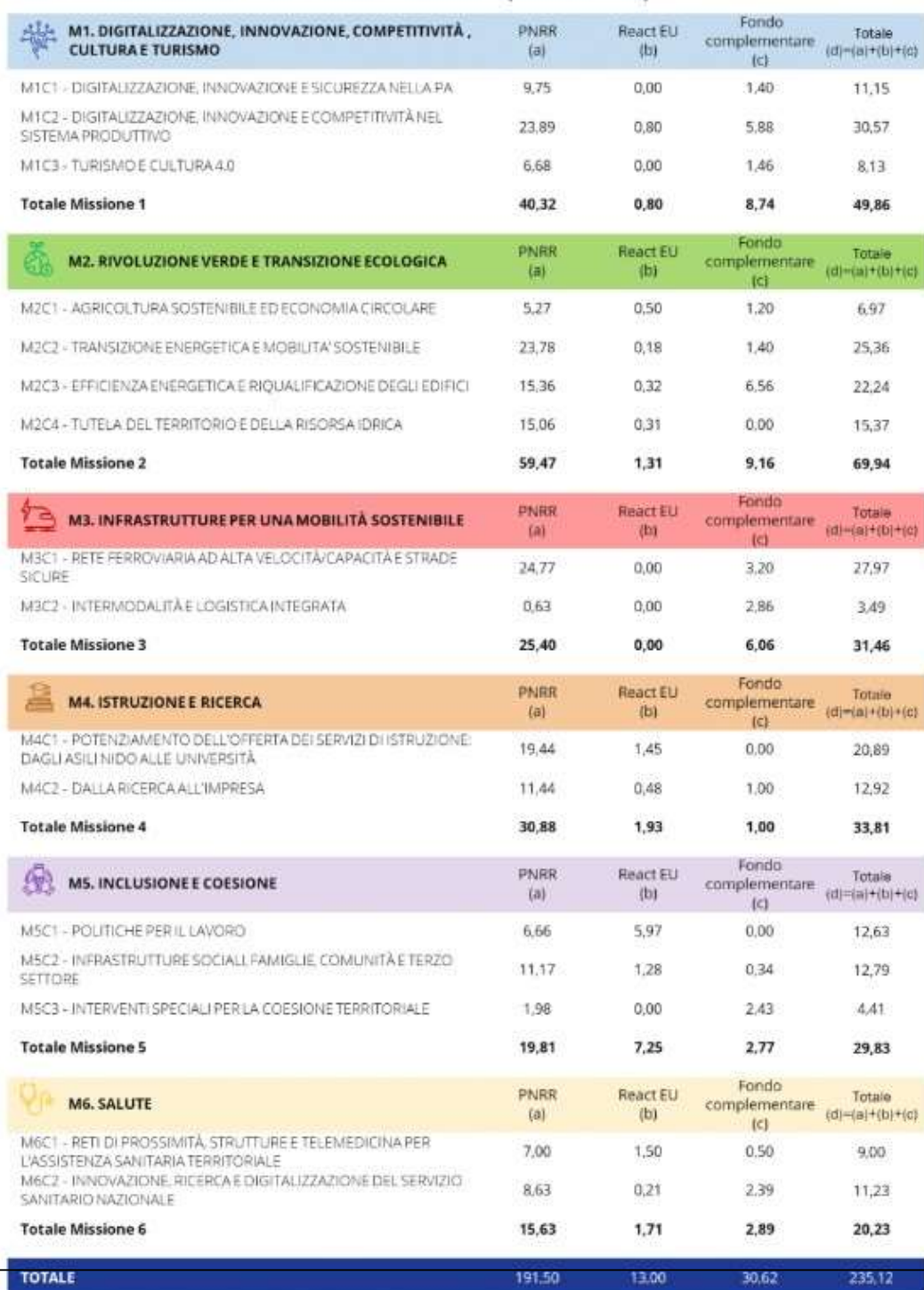
TAVOLA 1.1: COMPOSIZIONE DEL PNRR PER MISSIONI E COMPONENTI (MILIARDI DI EURO)

Un ulteriore riferimento per gli indirizzi e obiettivi strategici è rappresentato dal Piano nazionale di Ripresa e resilienza che orienta l'azione dell'amministrazione sempre in un'ottica di valore pubblico, il PNRR si sviluppa intorno a tre assi strategici condivisi a livello europeo, ovvero digitalizzazione, transizione ecologica, inclusione sociale, e si articola in 16 Componenti, raggruppate in sei Missioni: Digitalizzazione, Innovazione, Competitività, Cultura e Turismo; Rivoluzione Verde e Transizione Ecologica; Infrastrutture per una Mobilità Sostenibile; Istruzione e Ricerca; Inclusione e Coesione; Salute: