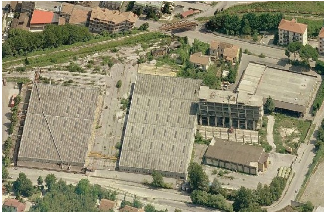
Vista ortofoto Isochimica

L'Amministrazione comunale è impegnata, già dal 2013, nella programmazione e realizzazione di interventi di bonifica ambientale interessanti l'area dell'ex Isochimica, ubicata nella zona di Pianodardine. L'ex stabilimento Isochimica, entrato in funzione nei primi anni '80, è restato in attività per quasi un decennio attuando il ciclo lavorativo di scoibentazione dell'amianto presente nei rotabili ferroviari (motrici e carrozze). Una parte rilevante dell'amianto rimosso è stato inglobato in cubi di cemento, stimati in quasi 600, depositati sul piazzale dello stabilimento Isochimica. Un'altra parte dell'amianto rimosso dai rotabili è stato, invece, sotterrato direttamente in diverse aree dello stabilimento individuate dai Piani di Caratterizzazione effettuati nel corso degli anni.