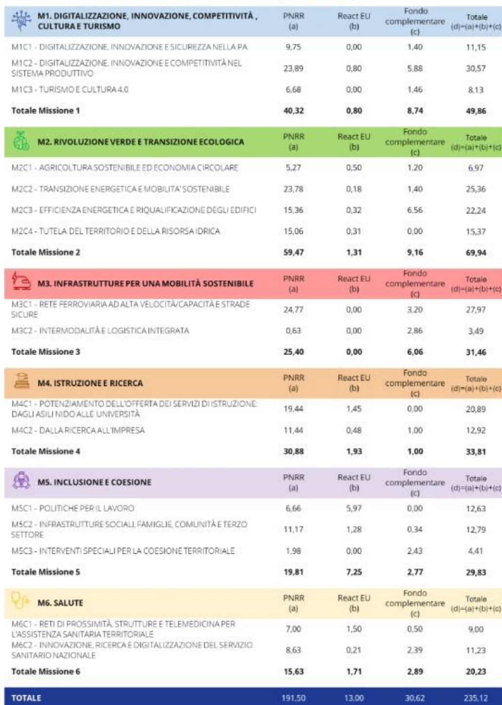
TAVOLA 1.1: COMPOSIZIONE DEL PNRR PER MISSIONI E COMPONENTI (MILIARDI DI EURO)

Una ulteriore riferimento per gli indirizzi e obiettivi strategici è rappresentato dal Piano nazionale di Ripresa e resilienza che orienta l'azione dell'amministrazione sempre in un'ottica di valore pubblico, il PNRR si sviluppa intorno a tre assi strategici condivisi a livello europeo, ovvero digitalizzazione, transizione ecologica, inclusione sociale, e si articola in 16 Componenti, raggruppate in sei Missioni: Digitalizzazione, Innovazione, Competitività, Cultura e Turismo; Rivoluzione Verde e Transizione Ecologica; Infrastrutture per una Mobilità Sostenibile; Istruzione e Ricerca; Inclusione e Coesione; Salute: