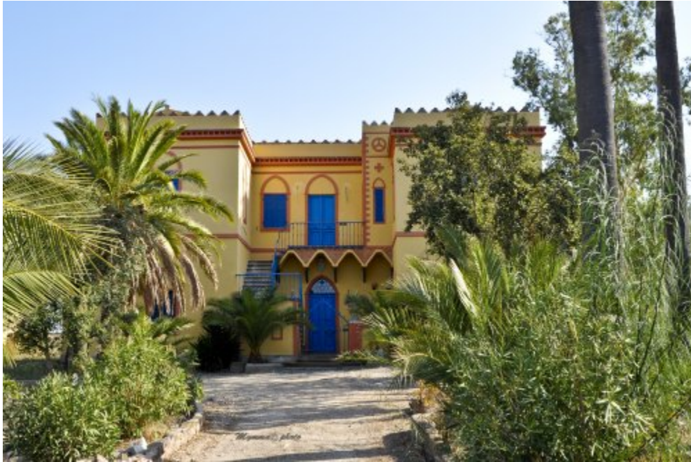
(Villa Salazar, edificata dall'Ing. Giorgio Asproni ai primi del 1900)